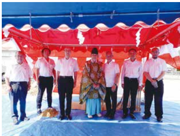
中領八幡宮宮司さんと