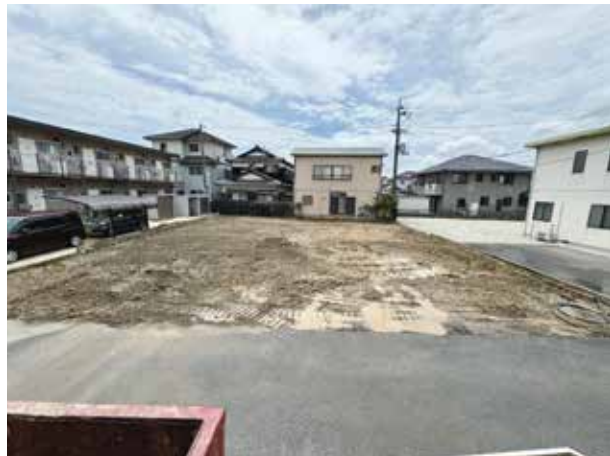
解体後の建築予定地