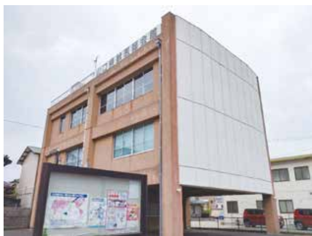
解体前の現獣医師会館

新会館の取得は、当初計画どおりに進捗しており、令和7年2月頃に工事完了・引き渡しとなる予定です。