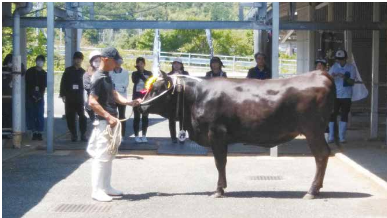
グランドチャンピオンの「こたけ」号

なお、この共進会の様子はNHKの昼と夕方の地方ニュースで放映されましたので見られた方もあるかと思います。