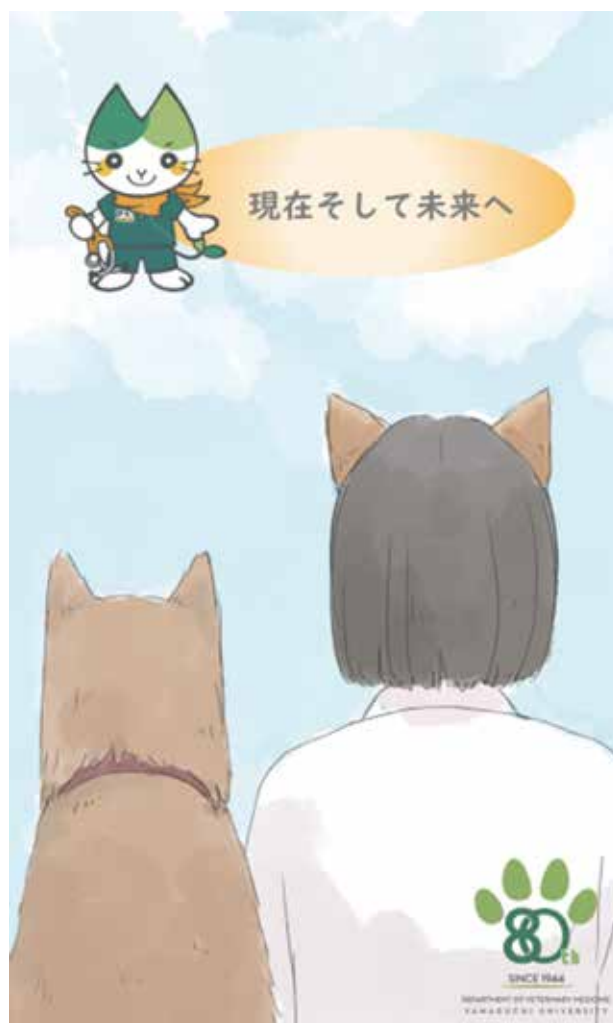
山口大学獣医学科創立80周年記念事業リーフレットより

山口大学ではこれからも、各支部の皆様と協力して地域に貢献できればと考えております。今後ともよろしく願いいたします。と、もう完全にただの業務連絡でした。来年はちゃんと寄稿をしてくれる先生に変わると思いますので許してください。